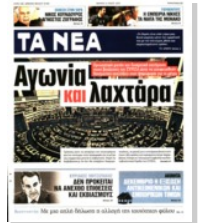
Το βιβλίο «Μεσα από τα Μάτια τους», στο οποίο συμπεριλαμβάνονται 12 ιστορίες ασυνόδευτων ανήλικων