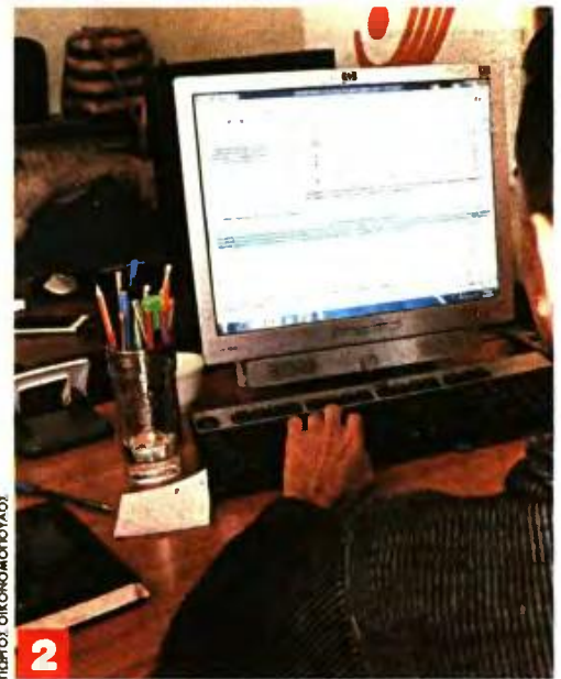
ΠΡΩΤΟΣ ΟΙΚΟΝΟΜΟΛΟΓΟΣ 2