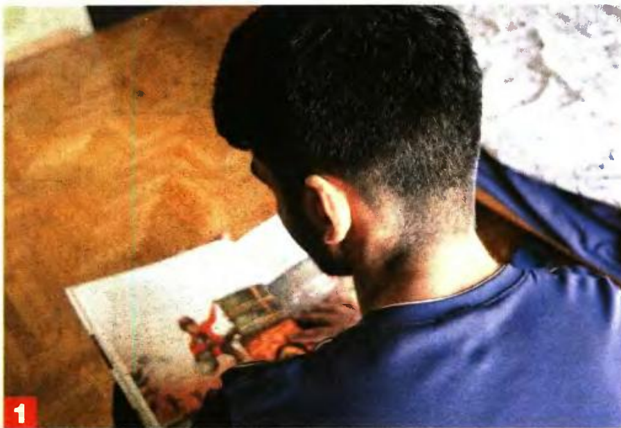
ΠΡΩΤΟΣ ΟΙΚΟΝΟΜΟΛΟΓΟΣ 1